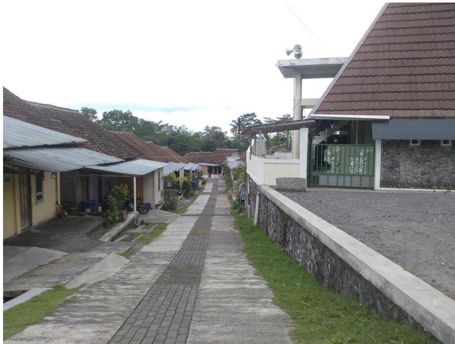
Fasilitas Masjid Huntap Batur