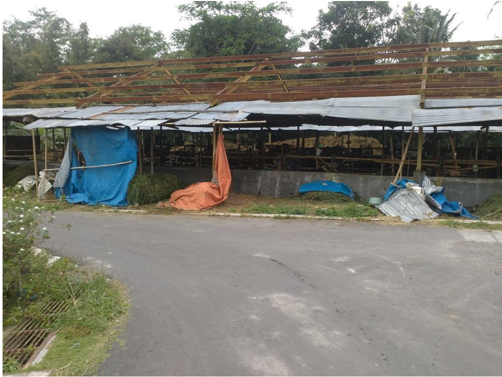
Kondisi Kandang Komunal Sedang di Renovasi