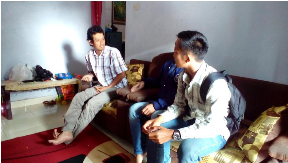
Wawancara dengan Ketua Rt 03