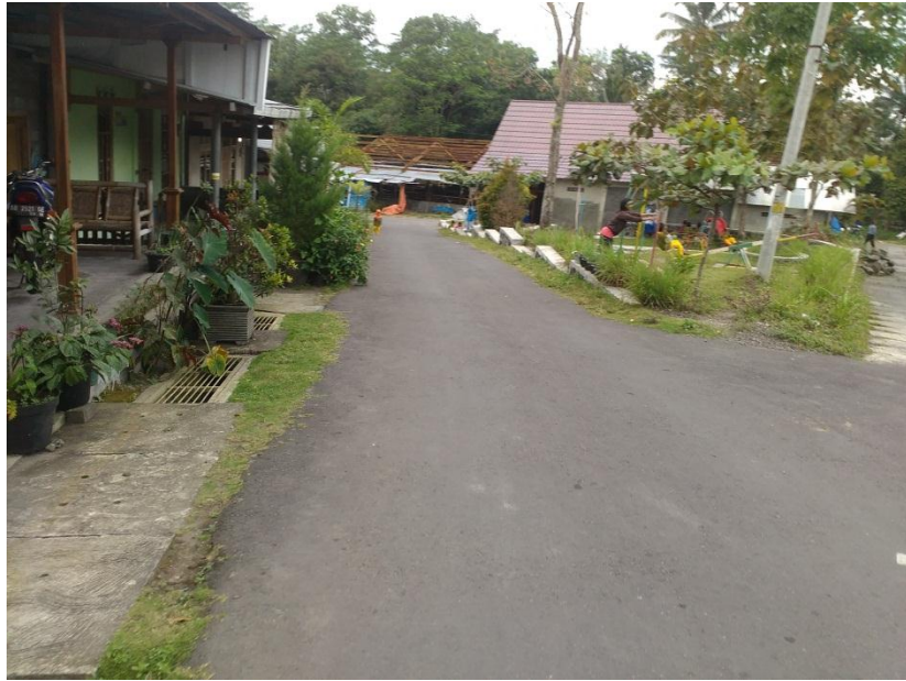
Fasilitas Pendidikan PAUD