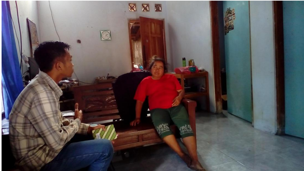
Wawancara dengan Ibu dari Ketua Rw