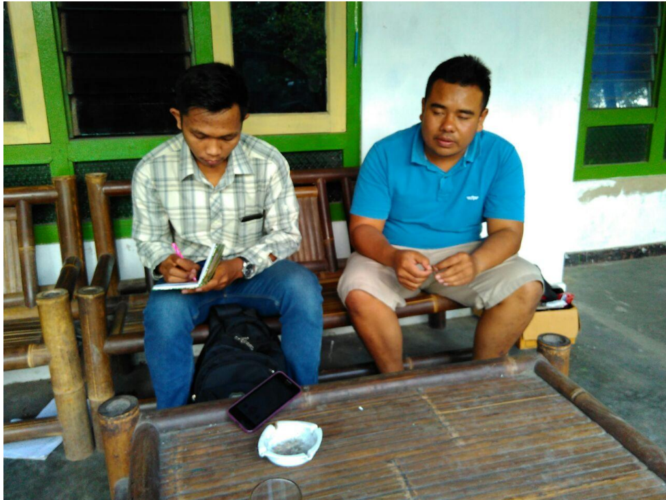
Wawancara dengan Kepala Dusun Kopeng