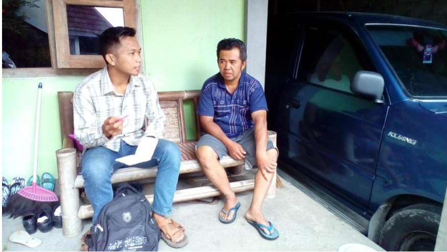
Saat wawancara dengan kepala Dusun Batur