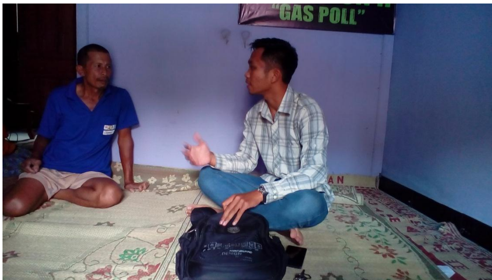
Wawancara dengan Ketua Rt 01