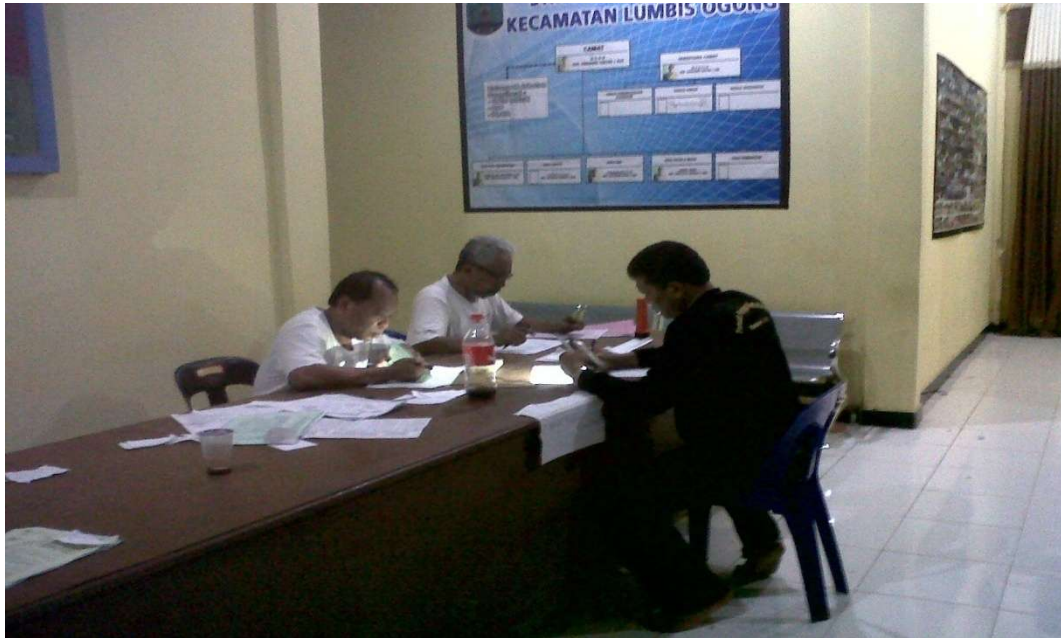
Foto kegiatan pembuatan E- KTP oleh pemuda Penjaga Perbatasan bekerjasama dengan Pemerintah Kecamatan dan Kabupaten