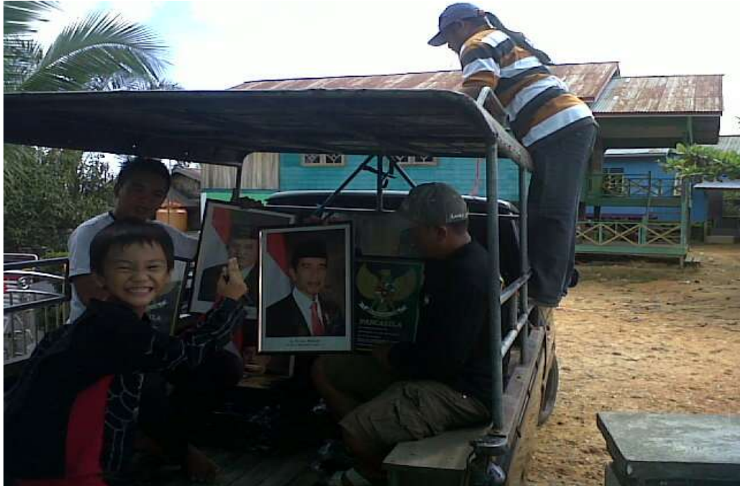
Foto Kegiatan dalam perekaman E-KTP oleh Pemuda Perbatasan di Lumbis Ogong