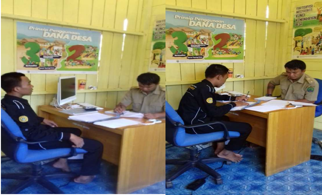
Wawancara Kepada Sekretaris jenderal Pemuda Penjaga Perbatasan RI