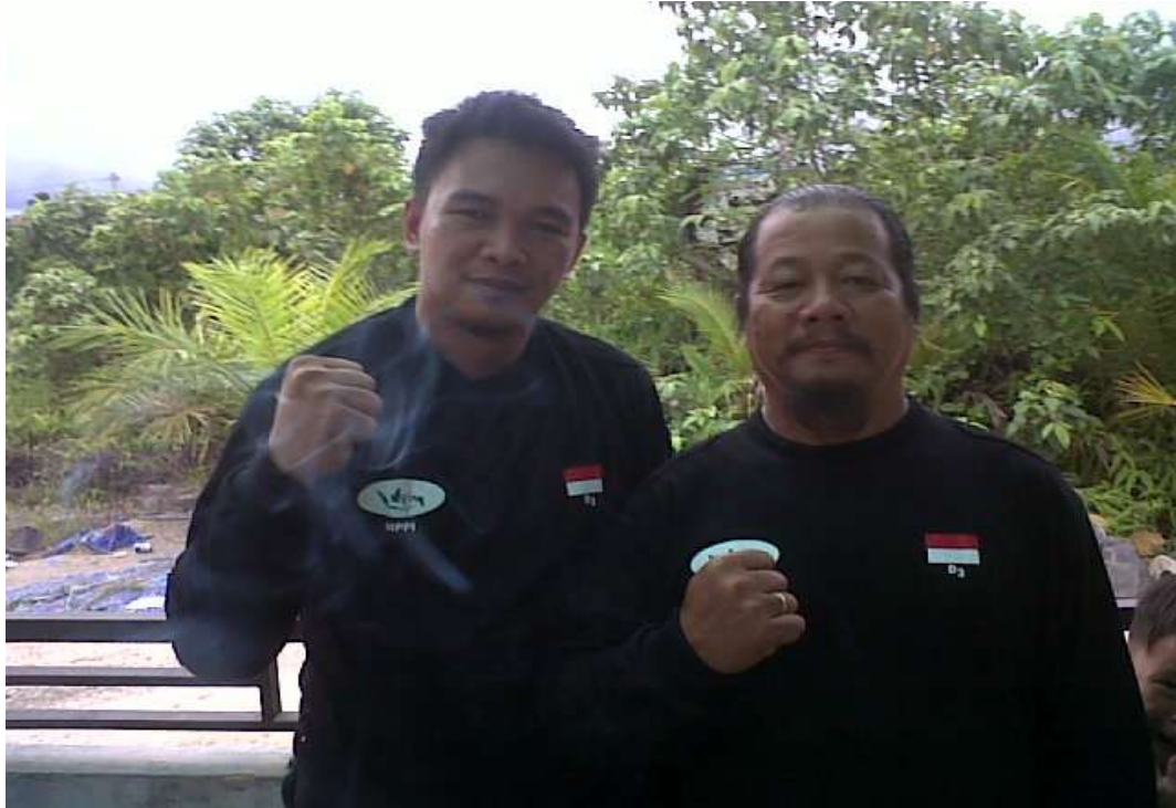
Foto Foto anggota Pemuda Perbatasan Lumbis Ogong