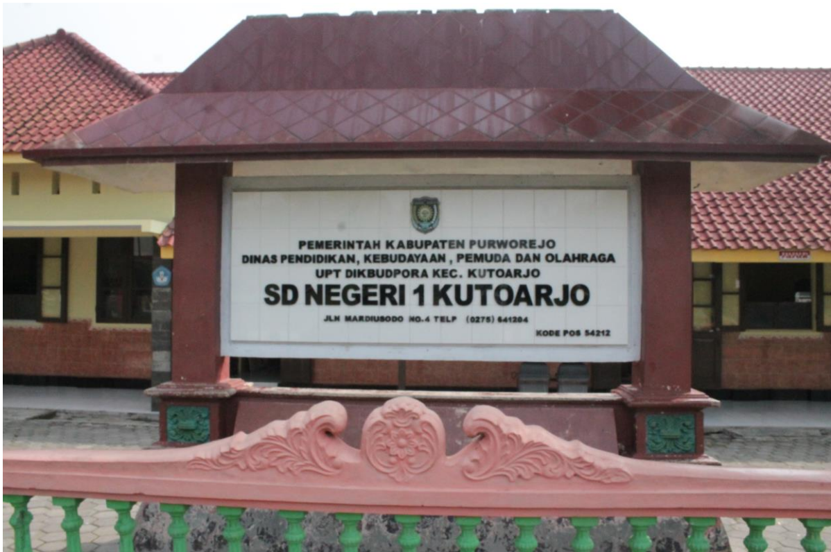
Gambar 1 : Papan nama SD Negeri 1 Kutoarjo