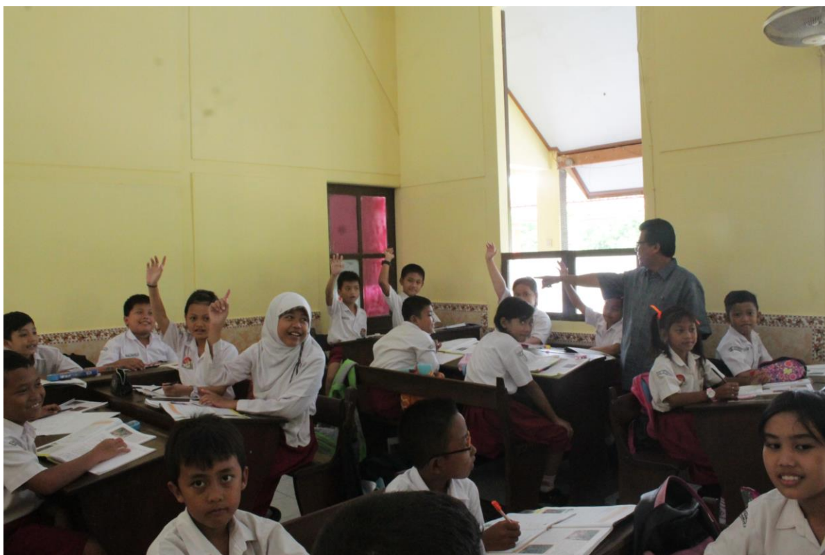
Gambar 3 : Siswa berebut menjawab pertanyaan