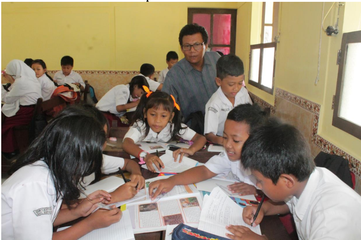
Gambar 2 : Siswa mengerjakan soal evaluasi