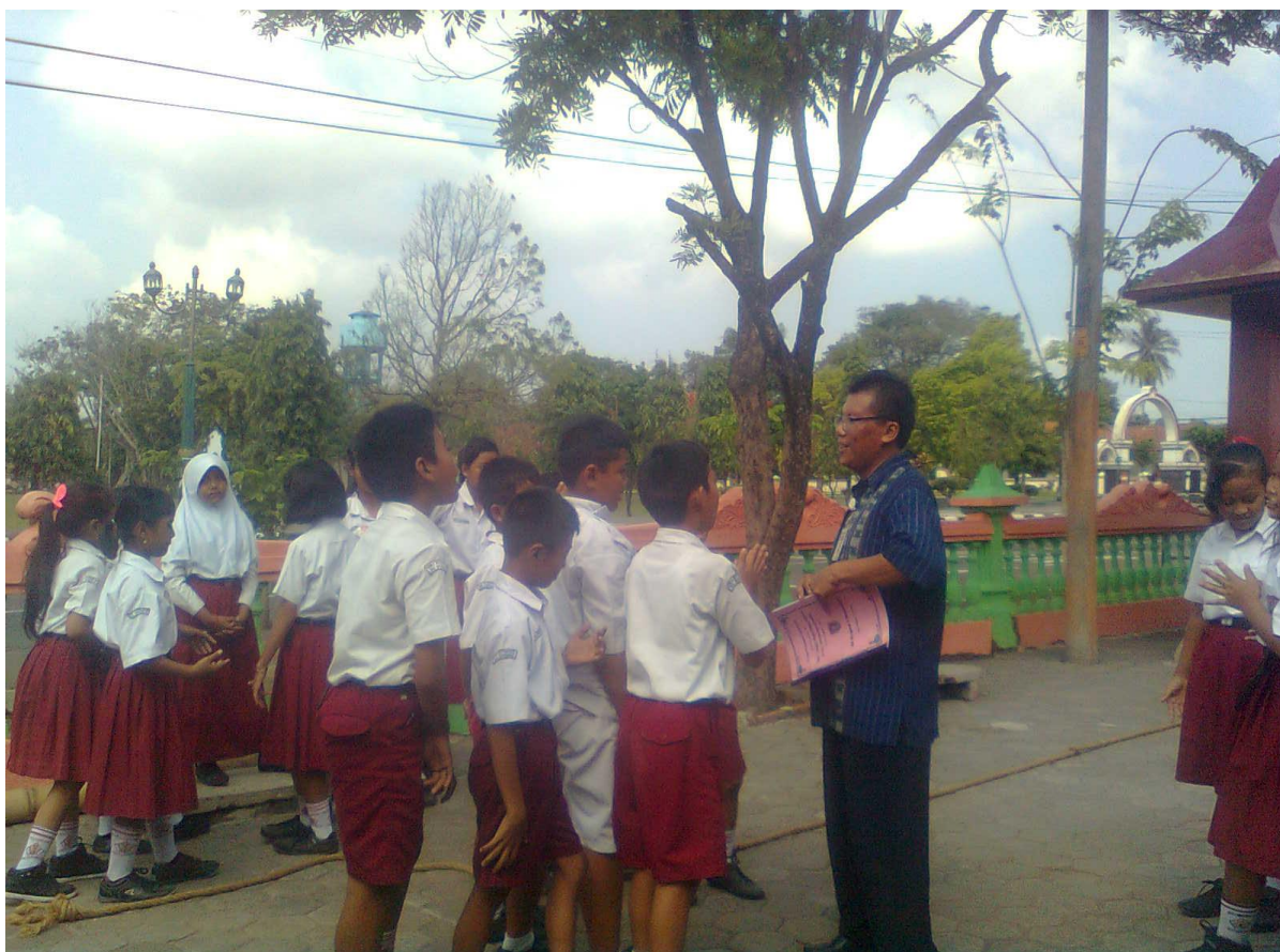
Gambar 5 : Siswa dan guru berkunjung ke koperasi sekolah