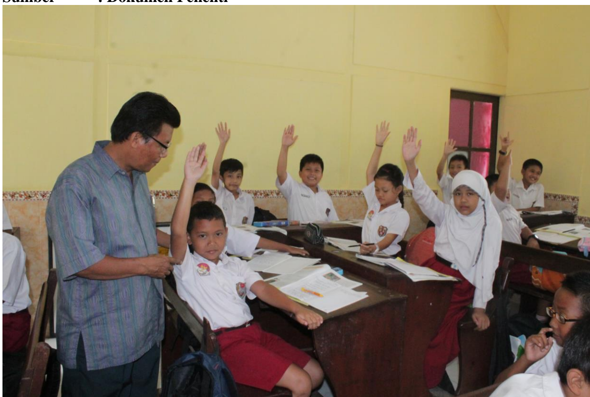
Gambar 4 : Guru menunjuk salah satu siswa untuk menjawab pertanyaan