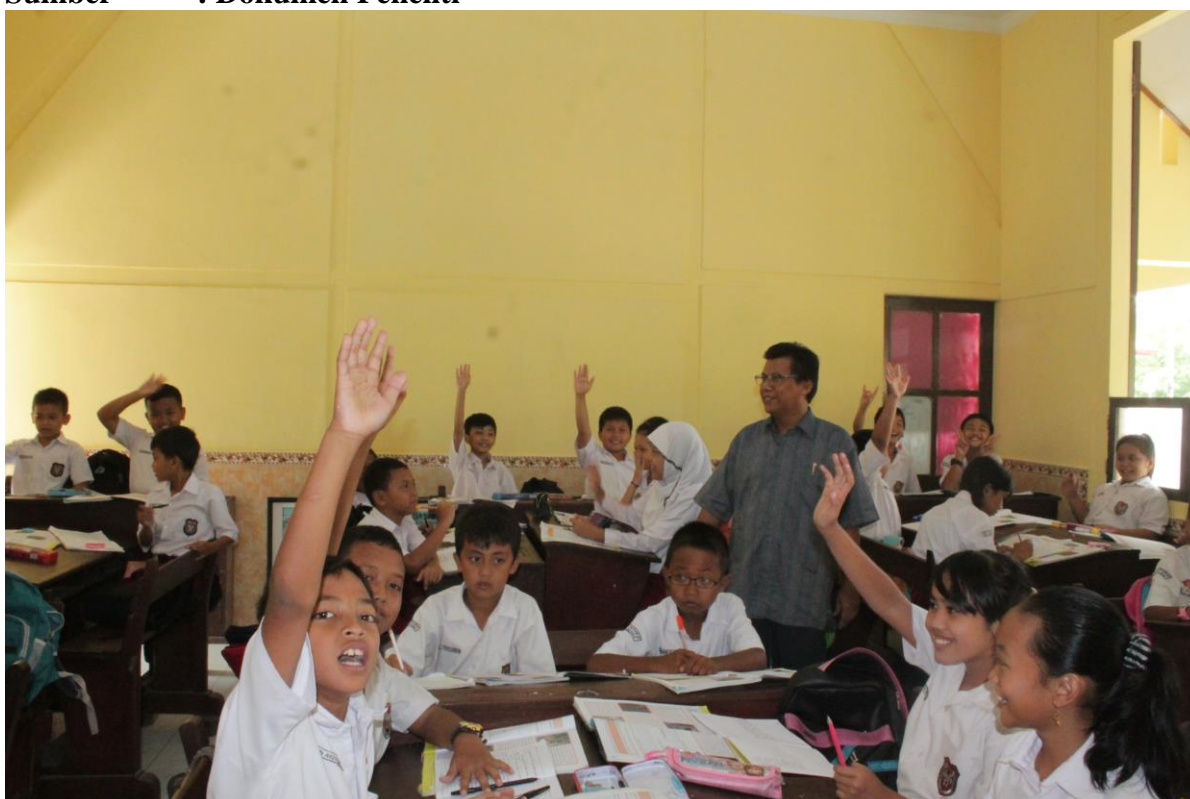
Gambar 6 : Siswa memberi apresiasi pada kegiatan hari itu