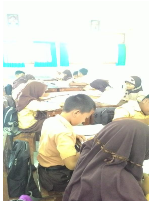
Guru Sedang Membimbing Siswa Saat Diskusi