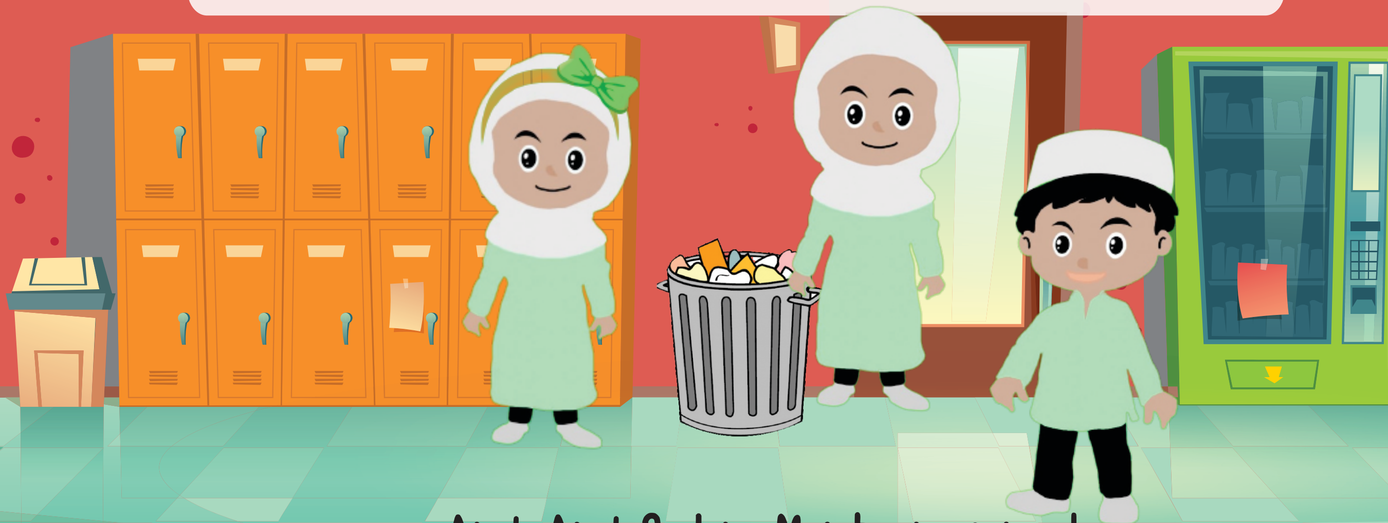
Anak-Anak Sedang Membuang sampah

"Anak-anak, setelah selesai makan kita harus peduli lingkungan dengan membuang sampah pada tempatnya." Jelas Bu Guru. "Baik Bu Guru!" Jawab para muid serentak.