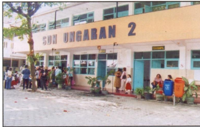
IKIP PGRI Yogyakarta meminjam SDN Ungaran 2 Yogyakarta tahun 1964-1981

Staf pengajar pada awal IKIP PGRI Yogyakarta antara lain :