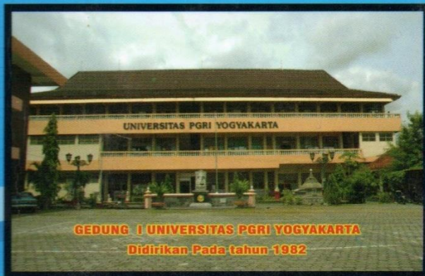
GEDUNG I UNIVERSITAS PGRI YOGYAKARTA Didirikan Pada tahun 1982