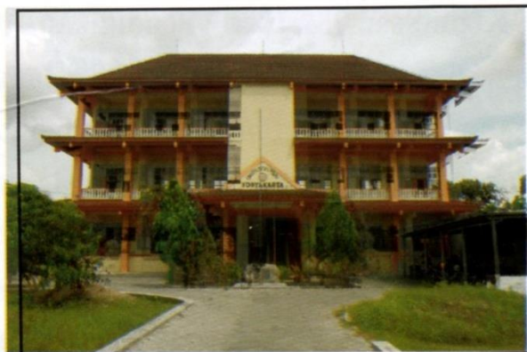
Gedung Unit III IKIP PGRI Yogyakarta Dibangan tahun 1989