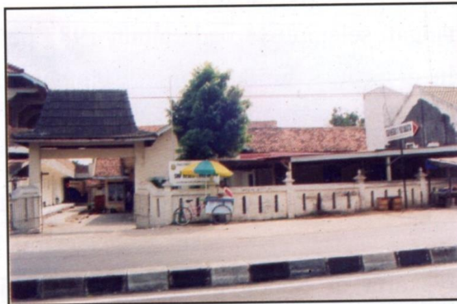
Gedung Perkuliahan IKIP PGRI Yogyakarta

Pada tahun 1981-1984 perkuliahan IKIP PGRI Yogyakarta tidak lagi di SD Ungaran tetapi dipindahkan ke kompleks SGPLB Negeri Yogyakarta dan SMP Negeri 4 Yogyakarta.