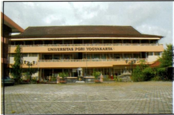
Gedung Unit I IKIP PGRI Yogyakarta dibangun tahun 1982