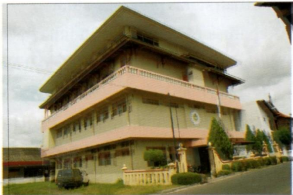
Gedung Unit II IKIP PGRI Yogyakarta Dibangun tahun 1990