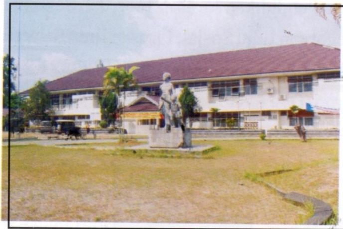
Gedung Perkuliahan SGPLB Tahun 1981-1984

Mulai tahun 1984 perkuliahan diselenggarakan di gedung milik sendiri yaitu gedung Unit I Jln PGRI I Sonosewu, tetapi sebagian penyelenggaraan kuliah masih dilaksanakan di SGPLB Negeri Yogyakarta.