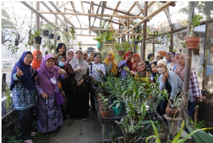
Gambar 8. Kegiatan Pelatihan Pengelolaan Sampah

Selanjutnya, evaluasi dilaksanakan setelah kegiatan pelatihan dan pendampingan. Evaluasi dilakukan untuk mengetahui feedback dari mitra terkait pelaksanaan kegiatan PKM, melalui pengisian kuesioner untuk beberapa jenis aspek penilaian. Hasil evaluasi melalui pengisian kuesioner disajikan pada Tabel 2 berikut. Pengisian kuesioner dilakukan oleh para peserta FGD dan Pelatihan yang berjumlah 30 orang.