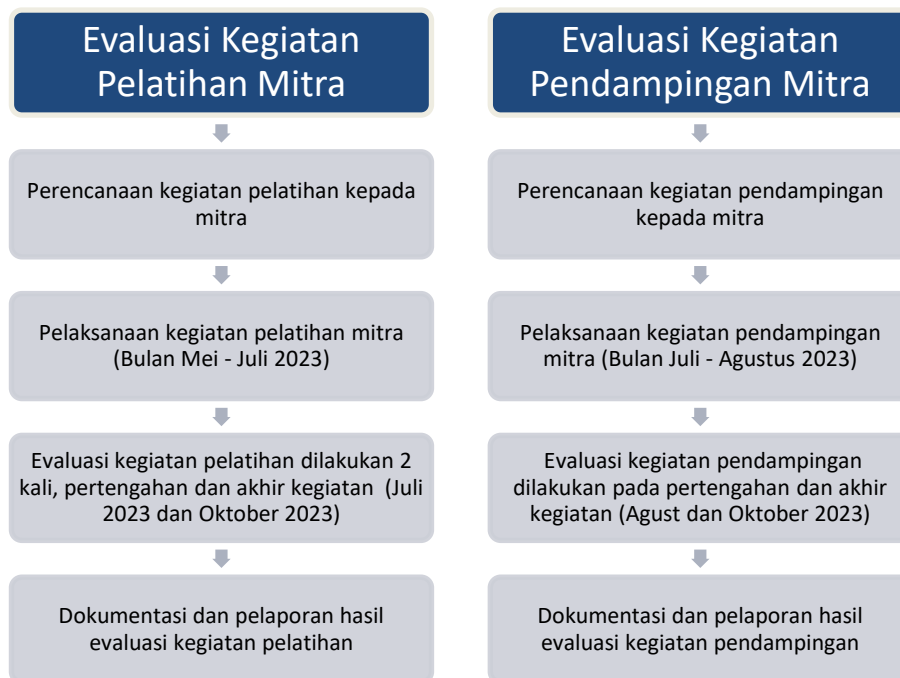
Gambar 6. Evaluasi pelaksanaan kegiatan

Evaluasi pelaksanaan kegiatan PKM akan dilaksanakan 2 (dua) kali, yaitu pada pertengahan dan akhir kegiatan pelatihan maupun pendampingan, seperti disajikan pada Gambar 6. Evaluasi pertama dilakukan terhadap kemampuan dan keberhasilan warga Dukuh Tambak dan KBS Mitra Melati pada proses pengelolaan sampah. Pada evaluasi pertama bertujuan untuk mengidentifikasi faktor keberhasilan dan ketidakberhasilan dari program yang dijalankan. Setelah itu, dicari solusi dan langkah perbaikan terhadap faktor ketidakberhasilan kemudian diimplementasikan. Setelah proses implementasi dari langkah-langkah perbaikan dilakukan evaluasi kembali untuk melihat keberhasilannya dan ketidakberhasilannya, evaluasi ini adalah evaluasi kedua. Proses evaluasi dilakukan dengan Focus Group Discussion (FGD) dan menggunakan kuesioner. Keberlanjutan program setelah PKM selesai dilaksanakan yaitu dengan mengadakan monitoring terhadap proses pengolahan sampah.