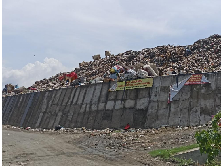
Gambar 2. Kondisi TPST Piyungan Bantul yang sudah melebihi kapasitas

Aksi pemblokiran dilakukan menyusul adanya antrian panjang truk pengangkut sampah yang akan membuang sampah ke TPST tersebut (Gambar 1). Warga sekitar mengeluhkan bau dan juga cairan yang keluar dari truk sampah saat antri masuk ke TPST Piyungan. Oleh karena itu, Pemerintah Kabupaten Bantul mencanangkan program Bantul bersih sampah hingga tahun 2025 [2]. Kondisi TPST Piyungan disajikan pada Gambar 2 dan tempat pembuangan sampah yang sudah meluas keluar area TPST Piyungan disajikan Gambar 3.