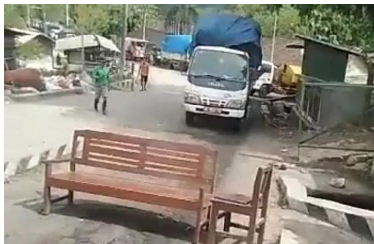
Gambar 1. Antrian Truk yang akan masuk ke TPST Piyungan

Program bersih sampah di Kabupaten Bantul diadakan karena jumlah pembuangan sampah per harinya bisa mencapai 400 ton. Sedangkan kemampuan untuk mengelola sampah hanya 100 ton per harinya. Capaian pengelolaan sampah pada tahun 2020 sebesar 62 persen karena bertambahnya jumlah pelanggan sampah. Sedangkan, Tempat Pembuangan Sampah Terpadu (TPST) Piyungan yang berada di Kecamatan Piyungan, Kabupaten Bantul, sudah melebihi teknis dan pengelolaan sampah yang kurang tepat [2], [3]. Bahkan pada bulan Oktober 2022, warga sekitar sempat memblokir truk sampah yang akan membuang sampah ke TPST Piyungan.