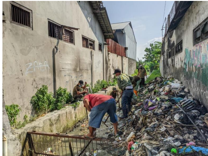
Gambar 4. Pembuangan sampah di aliran sungai di Padukuhan Tambak, Desa Ngestiharjo