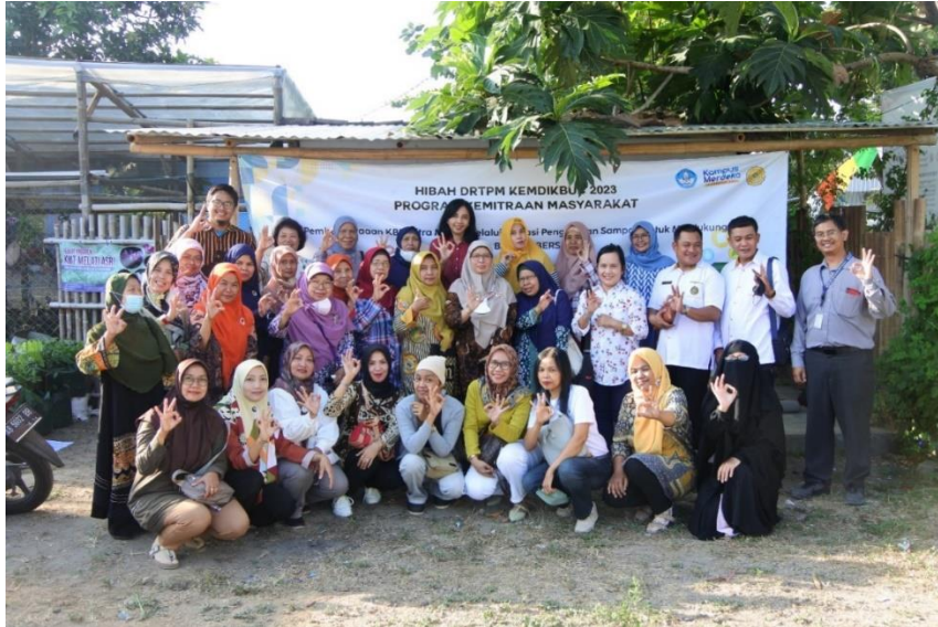
Gambar 7. Peserta FGD Pengelolaan Sampah