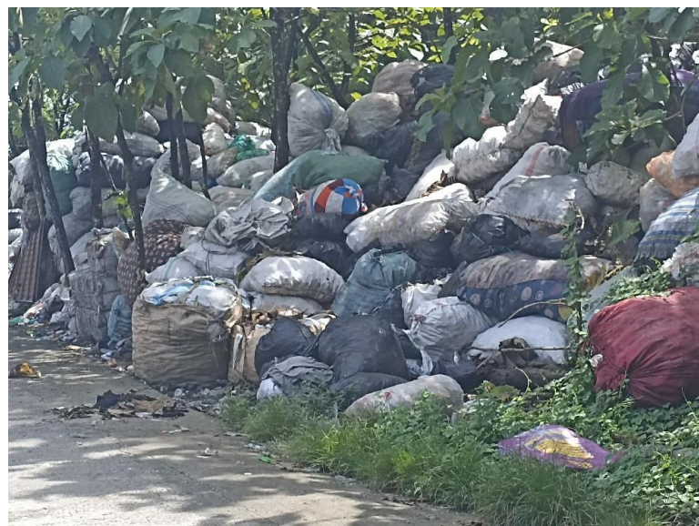
Gambar 3. Pembuangan sampah di sekitar TPST Piyungan Bantul