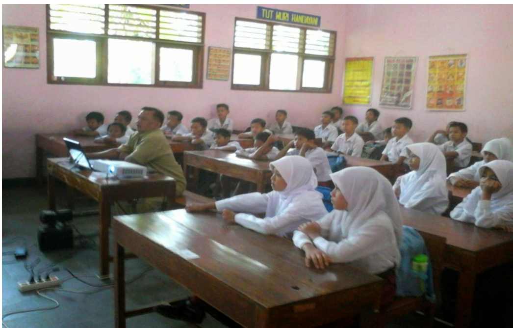
Foto 4. Tampak siswa antusias memperhatikan guru menjelaskan pembelajaran