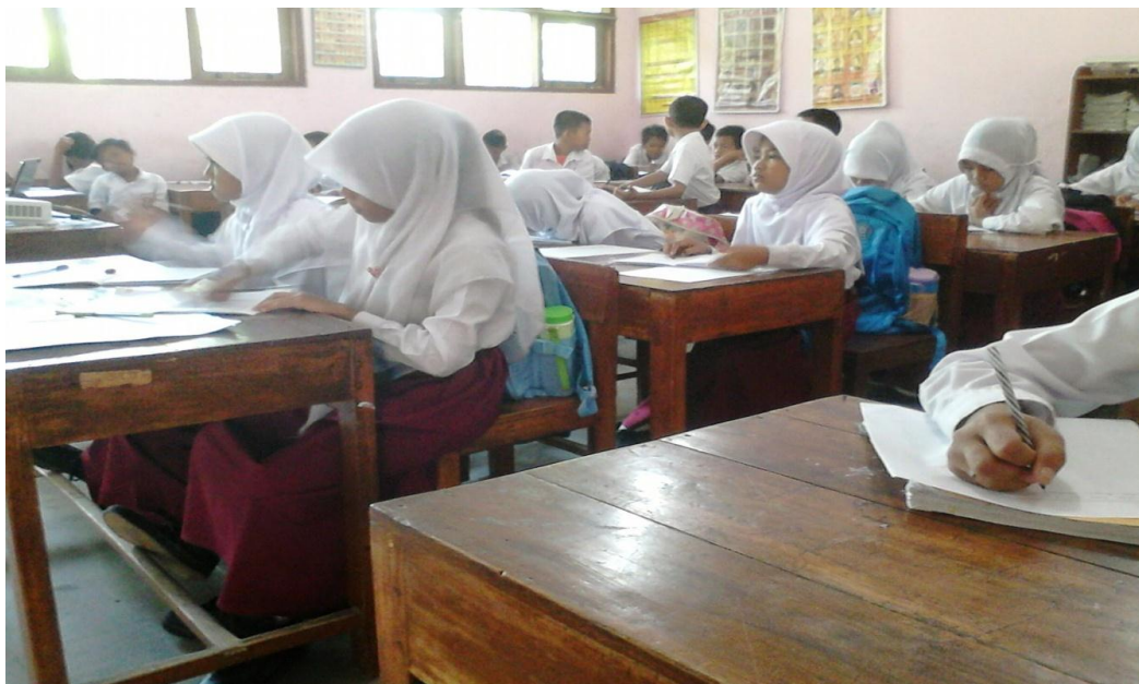
Foto 2. Tampak siswa sedang mengerjakan soal yang diberikan oleh guru Tindakan siklus II