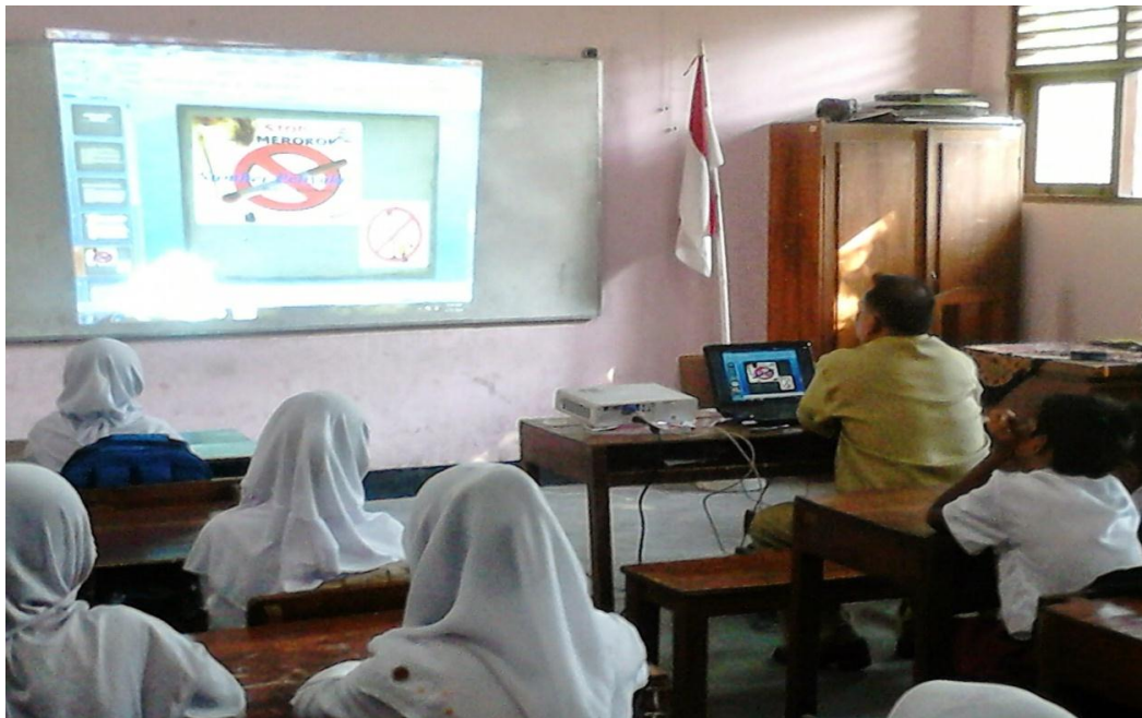
Foto 3. Tampak guru sedang menjelaskan materi menulis dengan menggunakan media poster menggunakan media LCD