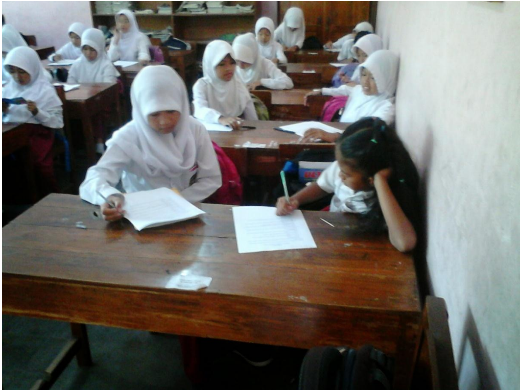
Foto 5. Tampak siswa sedang mengerjakan soal tagihan memnuat laporan pengamatan