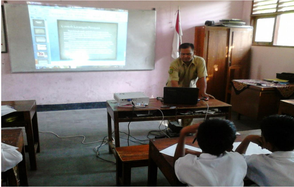
Foto 1. Tampak guru menjelaskan pembelajaran