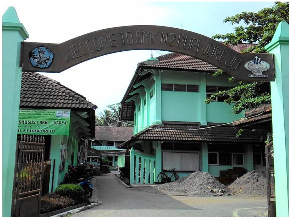
Gambar 1: Pintu Gerbang SMK Negeri 2 Purworejo