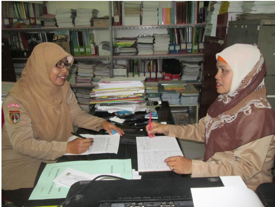
Gambar 5: Wawancara dengan Waka Kurikulum