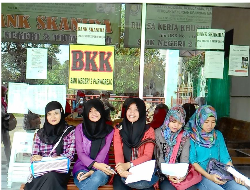
Gambar 2: Kantor BKK SMK Negeri 2 Purworejo