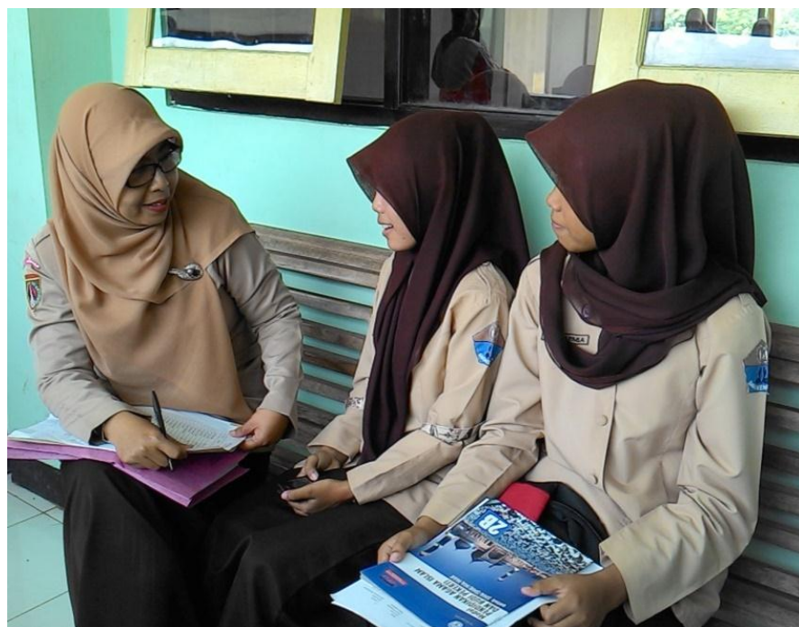
Gambar 8: Wawancara dengan Siswa Kelas XII