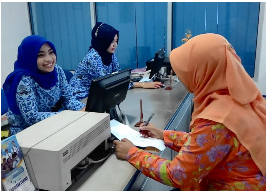
Gambar 7: Wawancara dengan Alumni yang Berprestasi