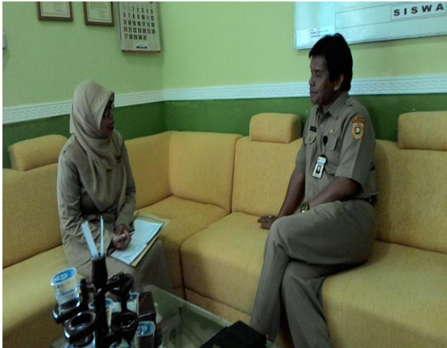
Gambar 3: Wawancara dengan Kepala Sekolah