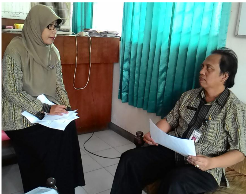
Gambar 4: Wawancara dengan Ketua BKK