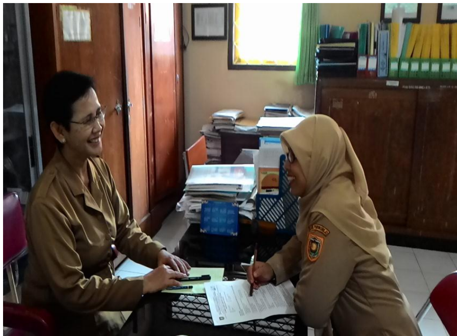
Gambar 6: Wawancara dengan Guru Kelas XII