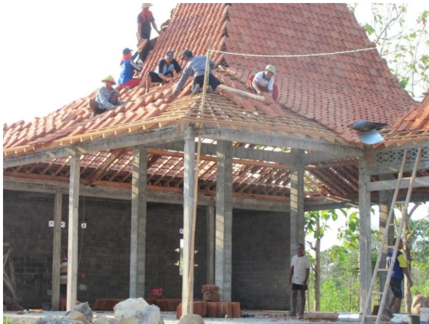
Foto pelaksanaan renovasi balai padukuhan di Dusun Karangasem B Desa Karangasem Kecamatan Paliyan Kabupaten Gunungkidul.