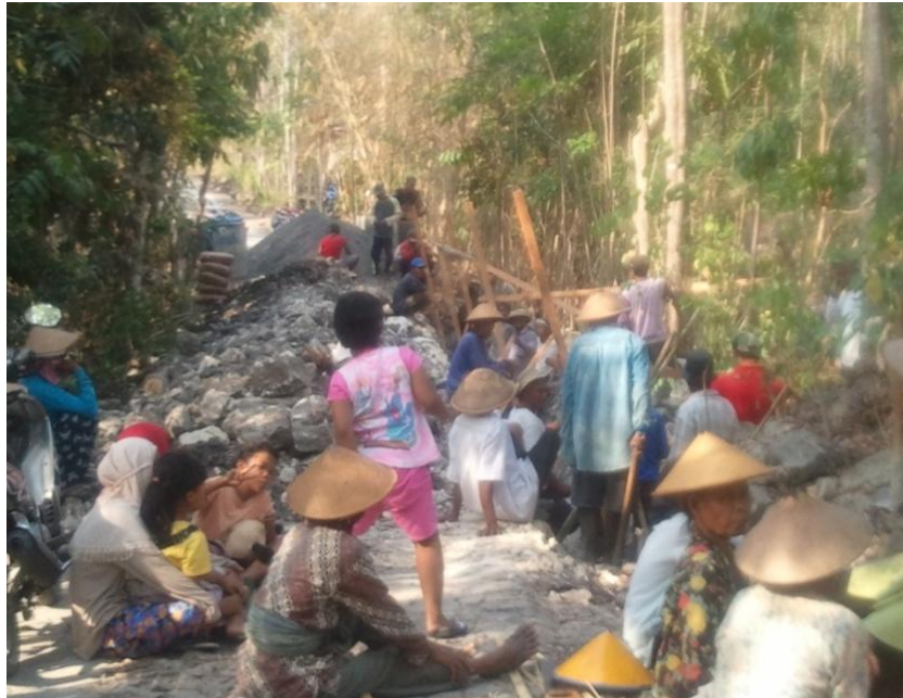
Foto pelaksanaan pembangunan talud di Dusun Cangkring Desa Karangasem Kecamatan Paliyan Kabupaten Gunungkidul.