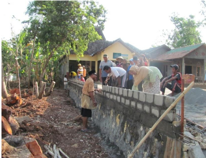
Foto pelaksanaan pembangunan pagar bumi balai padukuhan di Dusun Mengger Desa Karangasem Kecamatan Paliyan Kabupaten Gunungkidul.