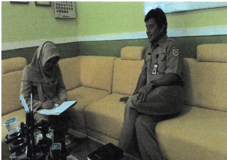
Gambar 2: Wawancara dengn Kepala Sekolah