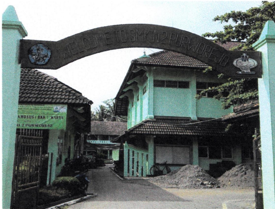
Gambar 1: Pintu Gerbang SMK N2 Purworejo