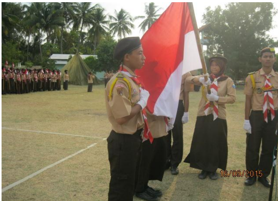
Gambar 7: Kegiatan Pramuka