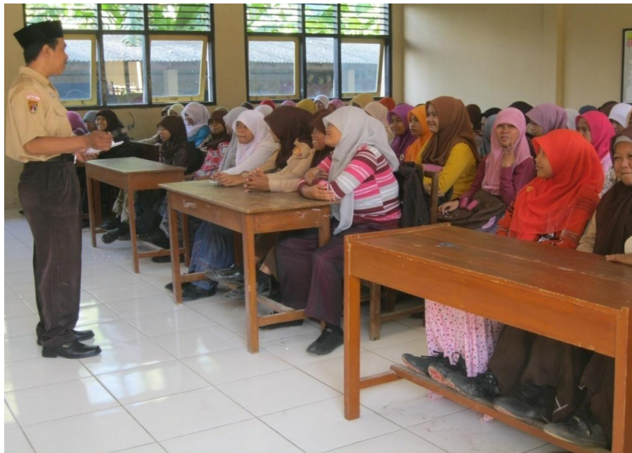
Gambar 5: Kegiatan Pesantren Kilat