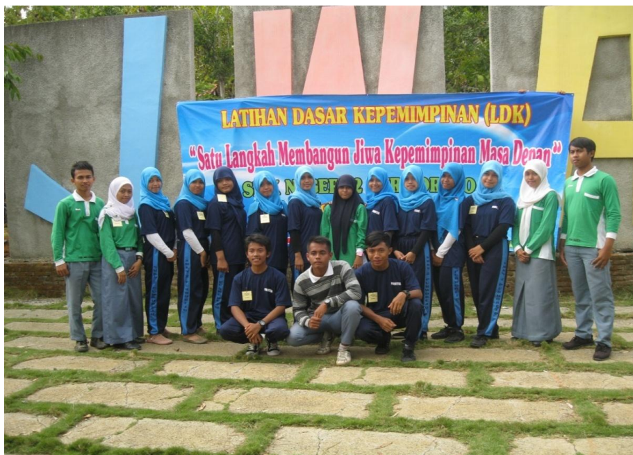
Gambar 4 : Kegiatan Latihan Dasar Kepemimpinan/LDK