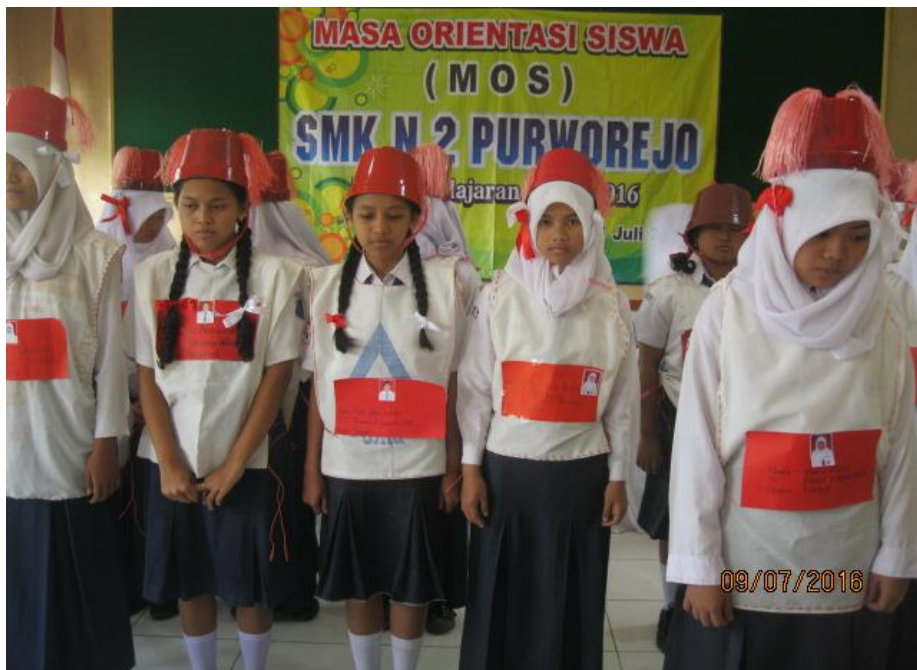
Gambar 3 : Kegiatan Masa Orientasi Siswa/MOS