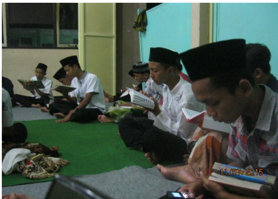
Gambar 6: Kegiatan Malam Bina Iman dan Taqwa