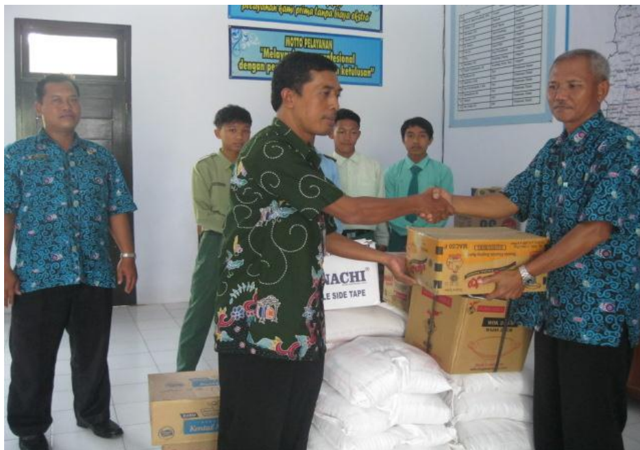
Gambar 8: Kegiatan Pemberian Bantuan Sosial / Bansos