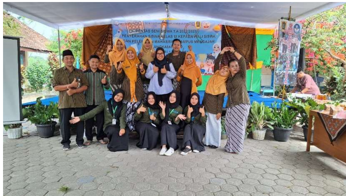
Bersama Dinas Pendidikan Kabupaten Klaten