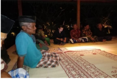
Gambar 2. Rapat Merti Dusun Kadilobo

Pada kegiatan rapat, struktur dan anggota panitia 5kan mendapatkan kepercayaan untuk dapat menyelesaikan tugas-tugasnya dengan baik. Oleh karena itu dalam pemilihan panitia dan pembagian tugasnya merupakan salah satu faktor penting menunjang kesuksesan kegiatan Merti Dusun .