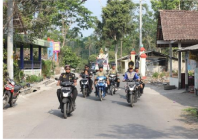
Gambar 4. Kirab Merti Dusun

yang dibutuhkan kurang, maka pementasan seni akan berjalan seadannya.