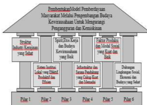
Gambar 3 Model Pembentukan Pemberdayaan Masyarakat Miskin

mengentaskan kaum miskin dan pengangguran dapat dibentuk dapat dilihat seperti pada Gambar 3 di bawah ini. Pada Gambar 3 ditemukan ada enam pilar utama yang dapat dibentuk dari sebuah model pemberdayaan yang dimaksud yaitu tiga dibangun dari pilar internal yakni; pilar struktur industri, kondisi perilaku kewirausahaan, dan faktor produksi dan modal sosial. Sedangkan tiga pilar pendukung dari sisi eksternal adalah kondisi keberadaan institusi lokal yang bijak dan efektif, kondisi infrastruktur dan sarana pendukung, serta lingkungan sosial, ekonomi dan budaya yang kondusif. Semua sub sistem dalam setiap pilar tersebut saling terkait dalam satu sistem yang diberi nama model sistem pemberdayaan warga masyarakat melalui pengembangan budaya kewirausahaan untuk mengentaskan pengangguran dan kemiskinan yang dimaksud.