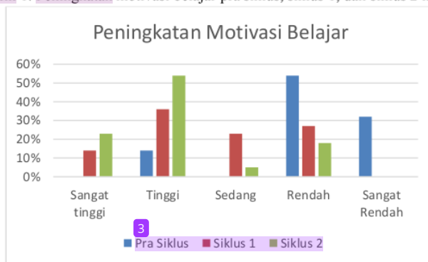
3 Grafik 1. Peningkatan motivasi belajar pra siklus, siklus 1, dan siklus 2 kelas 4

21 Peningkatan motivasi belajar peserta didik dapat dilihat dari grafik berikut.