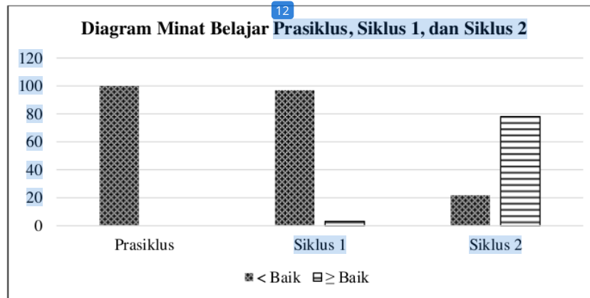
Gambar 10. Diagram Minat Prasiklus, Siklus 1, dan Siklus 2

Apabila disajikan ke dalam diagram, maka akan tampak pada gambar berikut ini.