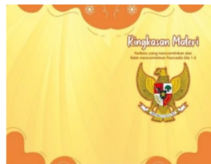
Gambar 2. Sampul Ringkasan Materi