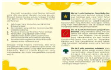
Gambar 3. Isi Ringkasan Materi