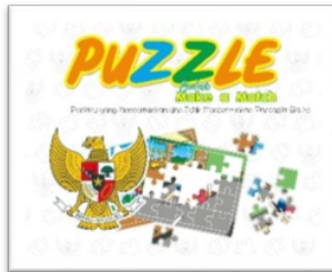
Gambar 1. Cover Produk