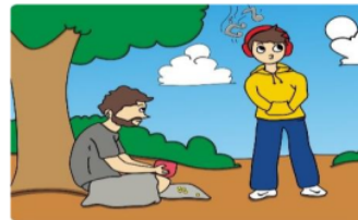
Gambar 6. Salah satu gambar dalam puzzle