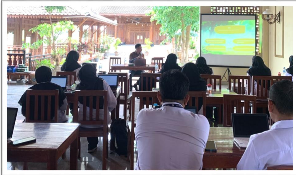
Gambar 1. Aktivitas Guru MGMP PPKn MTs Kabupaten Bantul.

Web: http://lppm.upy.ac.id Email: lppm@upy.ac.id