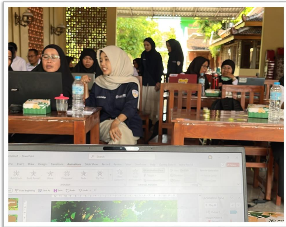
Gambar 8. Pendampingan Materi Workshop Oleh Dosen dan Mahasiswa

Web: http://lppm.upy.ac.id Email: lppm@upy.ac.id