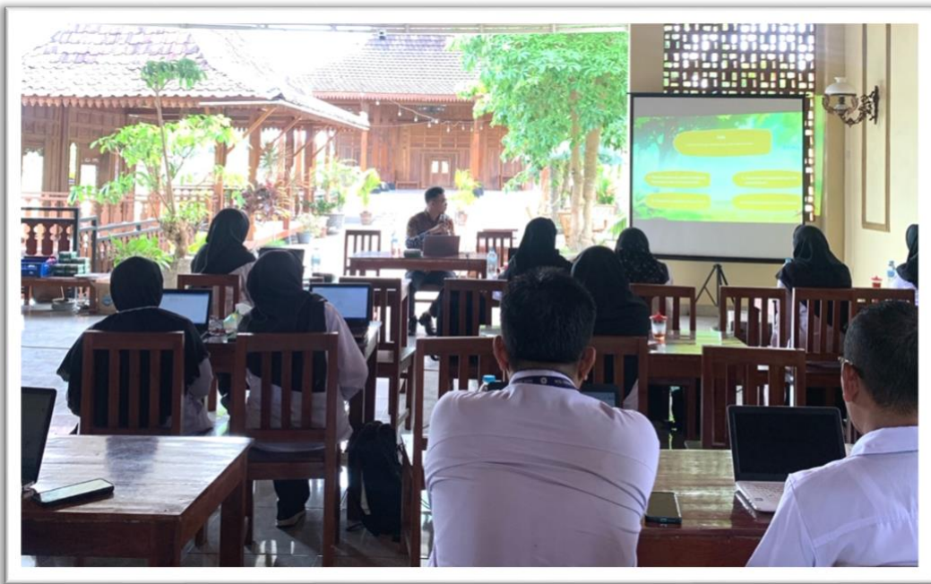
Gambar 6. Pemaparan Materi Workshop oleh Dosen

Web: http://lppm.upy.ac.id Email: lppm@upy.ac.id