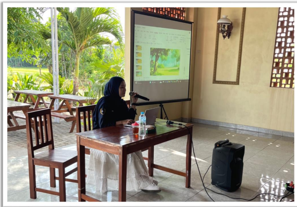
Gambar 7. Pemaparan Materi Workshop oleh Mahasiswa