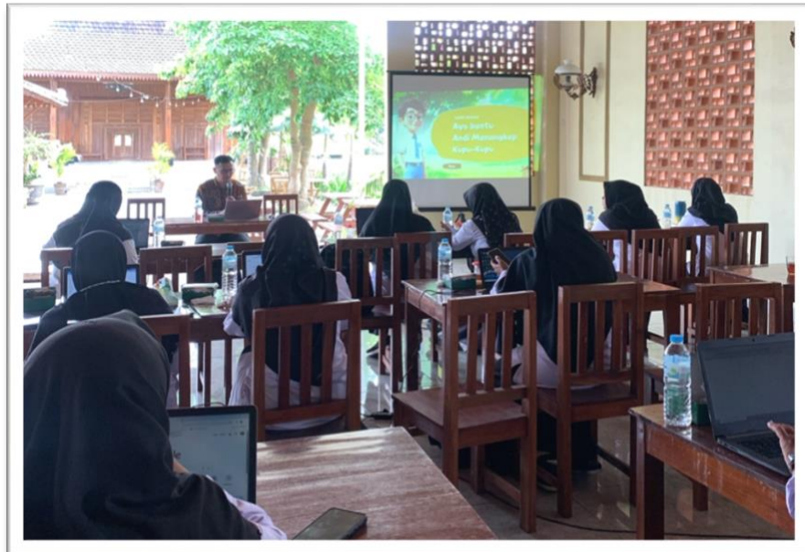
Gambar 4. Webinar Pembuatan Media PowerPoint

Pada bahasan bab ini akan difokuskan kembali secara praktis teknik mendesain secara dasar khususnya untuk desain media pembelajaran. Guna mendesain media pembelajaran hal-ha yang perlu diperhatikan adalah tentang pemilihan font, warna, gambar, ilustrasi dan berbagai hal yang menyangkut estetika dalam pembuatan desain. Hal tersebut dimaksudkan agar hasil yang dicapai dalam pembuatan media tersebut dapat maksimal, hasilnya terlihat bagus, dan dapat meningkatkan motivasi penggunaanya untuk menjalankan media tersebut.