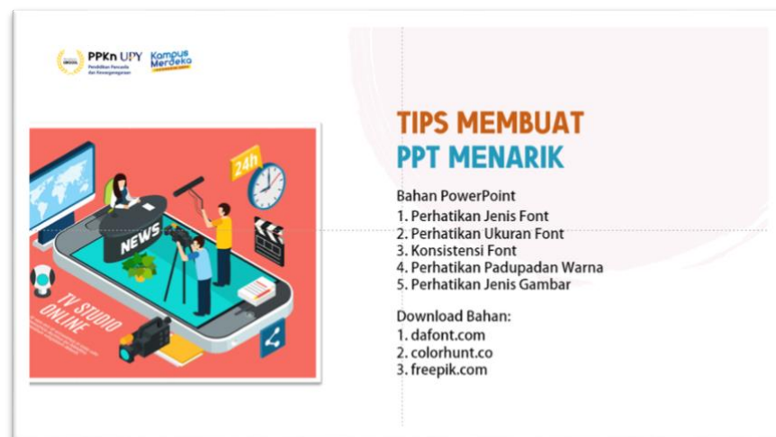
Gambar 3. Tips Pembuatan Media PowerPoint

Demikianlah gambaran secara umum pengertian tentang desain, khususnya tentang desain media pembelajaran serta langkah-langkah untuk mendesain pembelajaran. Pada intinya untuk mendesain media pembelajaran tentu saja harus disesuaikan dengan tujuan pembuatan media pembelajaran tersebut dengan melihat karakteristik peserta didik, tingkat kesulitan pembuatan media, serta dianalisis tentang ketercapaian media tersebut apabila diimplementasikan.