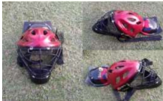
Gambar 6. Headgear (pelindung kepala)

Helm khusus hockey ( Head Gear ) berfungsi melindungi seluruh bagian kepala termasuk wajah. Pelindung kepala ini dalam hubungannya dengan helm memberikan perlindungan terhadap keseluruhan wajah secara permanen dan menutup keseluruhan kepala dan tenggorokan yang disarankan untuk dikenakan oleh penjaga gawang.