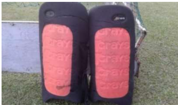
Gambar 8. Legguard

Pelindung kaki ( legguard ) berfungsi melindungi kaki dari benturan sebagai pengaman seorang Goalkeeper . Memiliki lebar maksimum 300 mm pada saar dikarenakan dikaki goalkeeper.