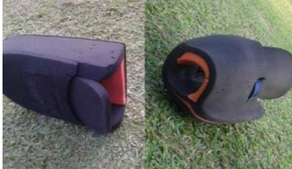
Gambar 10. Hand Protector

Hand Protector merupakan pelindung tangan yang berfungsi untuk melindungi tangan dari datangnya bola. Ukuran hand protector goalkeeper diukur menggunakan alat pengukur berdasarkan internal yang bersangkutan.