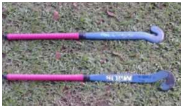
Gambar 4. Stick Hockey