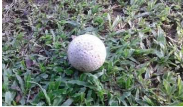
Gambar 5. Bola Hockey

Bola hockey berbentuk bulat, keras dan berwarna putih (warna lain yang disepakati, sepanjang warnanya kontrak dengan permukaan lapangan permainan) seperti :