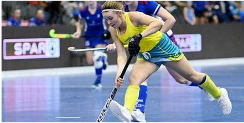
Gambar 1. Hockey Indor