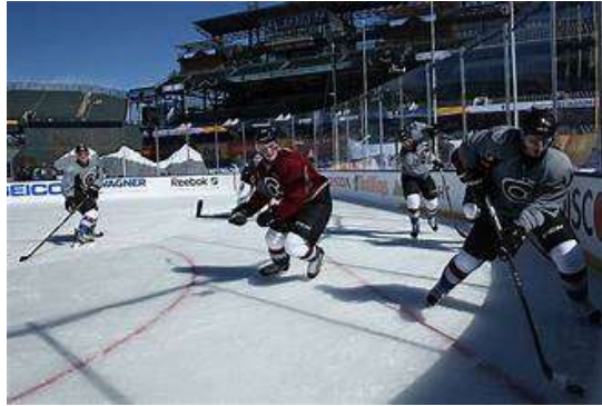
Gambar 3. Hokey Es

sepatu skating. Sebab lapangan yang digunakan juga berbentuk lapangan es, pemakaian sepatu skating ini bertujuan agar pemain dapat berlari lebih cepat dan lancar pada saat meluncur.