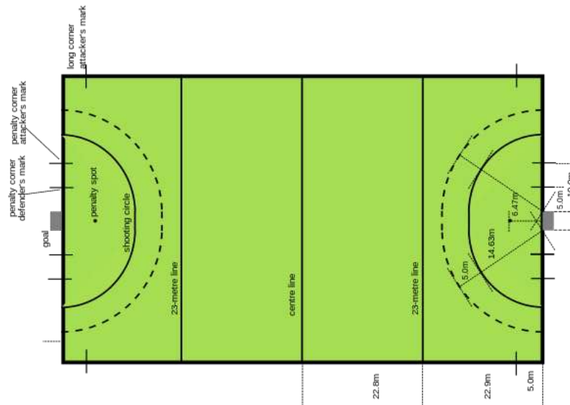
Gambar 12. Lapangan Hockey

Pada hockey lapangan jumlah atlit yang bermain berjumlah 11 pemain termasuk dengan 1 orang penjaga gawang ke-2 tim. Hockey filed menggunakan lapangan rumput dengan luas lapangan 60 yard x 100 yard dengan ukuran gawang 7 fit x 4 yard, berikut merupakan gambar lapangan filed.