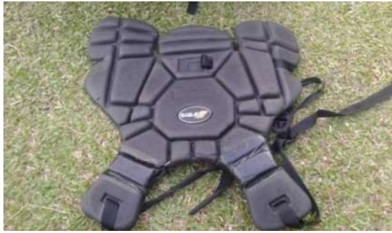
Gambar 7. Body Protector

Body Protector merupakan pelindung tubuh yang berbahan keras dilengkapi dengan busa. Fungsinya melindungi tubuh dari datangnya bola.