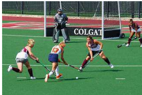
Gambar 2. Hockey Outdoor

Olahraga hockey lapangan adalah permainan hockey yang dimainkan di lapangan berumput(terbuka). Namun, pada zaman modern ini sudah ada yang menggunakan rumput sintetis. Pria maupun wanita semua dapat melakukan permainan hockey, bahkan dengan khusus untuk permainan wanita jumlahnya justru lebih dominan di daerah amerika dan di daerah kanada.