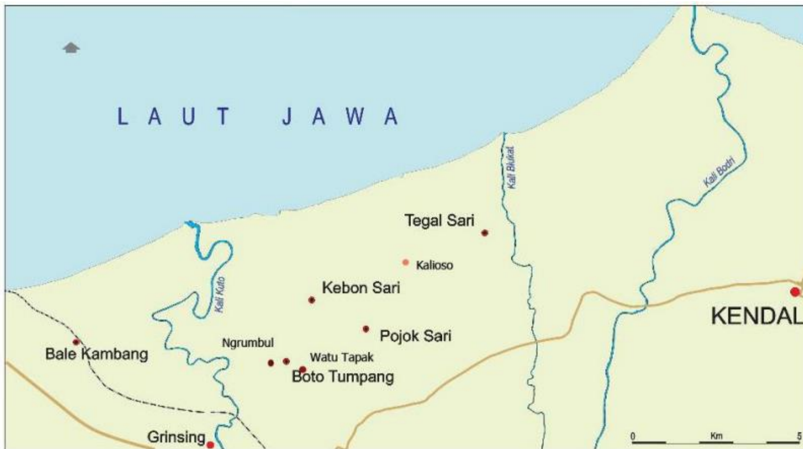
Gambar 1. Peta sebaran situs arkeologi di Pantai Utara Kendal.