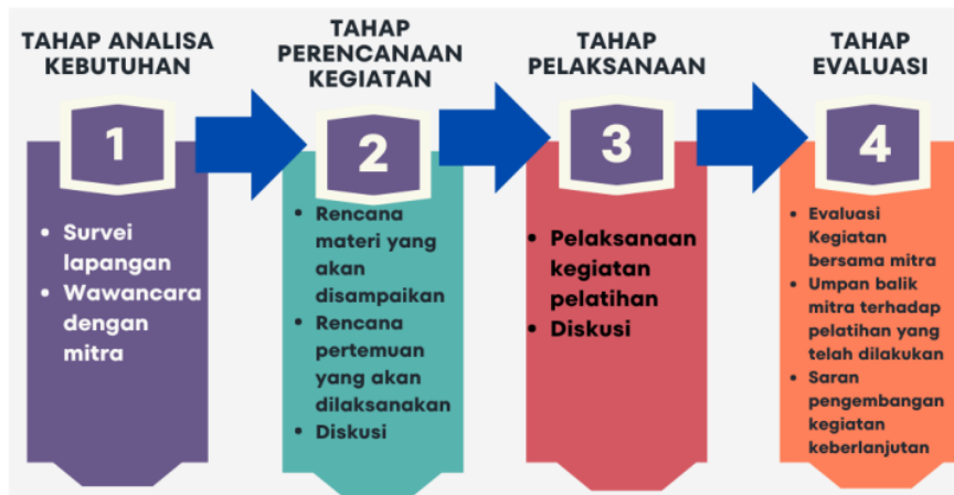
GAMBAR 1. TAHAPAN PENGABDIAN DI CV TOTALINDO GEMILANG

Kegiatan pengabdian kepada masyarakat ini bertujuan untuk meningkatkan kemampuan pemasaran produk pangan lokal di CV Totalindo Gemilang melalui pelatihan teknologi berbasis web. Kegiatan pengabdian masyarakat ini adalah melakukan pelatihan kepada karyawan CV Totalindo Gemilang dengan memberikan materi berupa pandalaman materi internet dan website. Kegiatan Pengabdian ini dilakukan dalam beberapa tahap, yaitu tahap analisa kebutuhan, tahap perencanaan, tahap pelaksanaan, dan tahap evaluasi. Secara bagan, metode dalam kegiatan pengabdian kepada masyarakat ini dapat dilihat pada gambar 1 berikut ini.