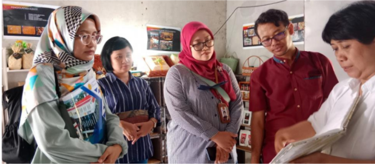
GAMBAR 3. WAWANCARA DAN OBSERVASI, MITRA SEDANG MENJELASKAN PRODUK DAN MEDIA PROMOSI YANG TELAH DILAKUKAN.