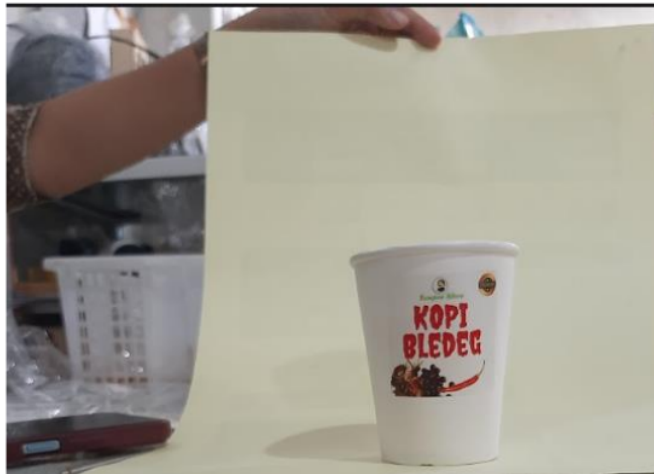
GAMBAR 6. PROSES PEMBUATAN KONTEN UNTUK DITAMPILKAN DALAM WEBSITE.

Tahap selanjutnya adalah proses pembuatan konten untuk ditampilkan dalam website. Dalam proses ini produk yang telah dihasilkan difoto satu-satu untuk ditampilkan dalam website. Proses pengambilan foto dapat dilihat pada gambar 6 berikut ini.