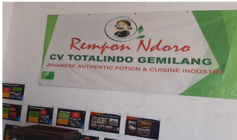
GAMBAR 2. SURVEI DI CV TOTALINDO GEMILANG.

Survei dan Analisa kebutuhan dilakukan dengan metode wawancara dengan Itur Yuliasdik, selaku pemilik dari CV Totalindo Gemilang. Itur menjelaskan detail mulai dari awal berdiri CV Totalindo Gemilang, hingga ujian ujian yang dihadapi dan berhasil survive sampai masih berdiri kokoh hingga saat ini.