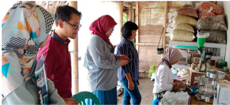
GAMBAR 5. PROSES MEMILIH KONTEN UNTUK DITAMPILKAN DALAM WEBSITE.

Tahap selanjutnya adalah proses pembuatan konten untuk ditampilkan dalam website. Dalam proses ini produk yang telah dihasilkan difoto satu-satu untuk ditampilkan dalam website. Proses pengambilan foto dapat dilihat pada gambar 6 berikut ini.