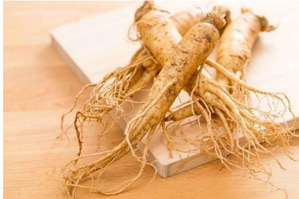
Gambar 3 (Gingseng)

Ginseng merupakan bahan berupa akar-akaran dari Korea yang mengandung dametrene triol glikosida, yang mempunyai efek merangsang sekresi adrenalin dalam tubuh sehingga membuat orang lebih aktif. Ginseng biasanya dikonsumsi dalam bentuk cairan, kapsul, obat-obatan maupun jamu. Sampai saat ini belum ada larangan penggunaan ginseng bagi olahragawan.