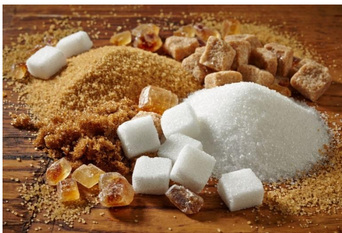
Gambar 2 (Gula)

Gula merupakan karbohidrat sederhana yang mudah diserap usus halus untuk menghasilkan energi guna kinerja fisik. Konsumsi gula yang pekat (hipertonik) lebih dari 2,5 gram/100 cc menyebabkan terjadinya shock insulin atau rebound