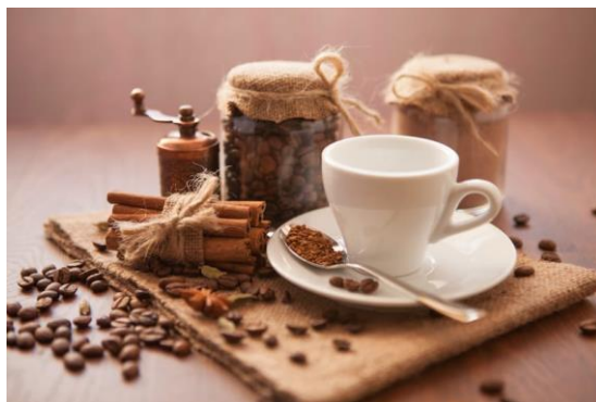
Gambar 1 (kafein)

Kafein terdapat pada minuman kopi, teh, dan coklat yang berpengaruh terhadap perangsangan otot jantung, sehingga meningkatkan frekuensi kontraksi, merangsang susunan syaraf yang menjadikan orang lebih siaga dan mempunyai efek vasodilatasi pada pembuluh darah perifer. Pemakaian kafein bagi atlet sebaiknya dihindarkan sebabakan merugikan kinerja saat bertanding seperti denyut jantung berlebihan, memacu produk urin dan bagi atlet yang sensitif menyebabkan depresi yang membuat atlet gelisah serta menderita insomnia. Konsumsi kafein berlebihan pada atlet dianggap doping apabila konsentrasi dalam urin lebih dari 12 ug/ml (minum 15 cangkir kopi sehari, sudah dianggap doping).